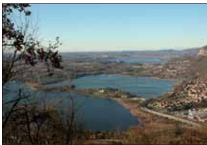
Dal Barro - I Laghi della Brianza