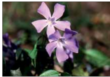
Pervinca ( Vinca minor )