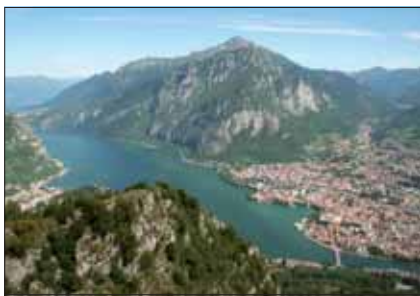
Dalla vetta - Il Lago di Lecco