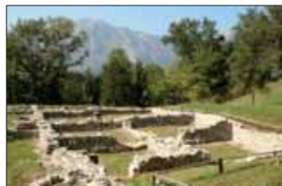
Parco Archeologico dei Piani di Barra

guidato da pannelli didascalici nella visita dei resti dell'abitato, costituito da una dozzina di edifici. Sul versante meridionale del monte è visibile anche il muro di fortificazione, localmente detto muraiö , che racchiudeva il sito, con tre torri su altrettanti crinali.