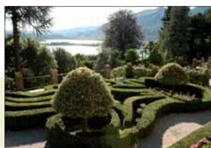
I giardini di Villa Bertarelli

I saloni della porzione della villa di proprietà del Comune di Galbiate sono sede di prestigiose mostre d'arte, di concerti e di eventi culturali