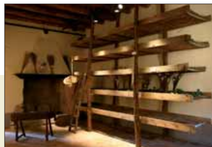
Sala del museo dedicata alla bachicoltura

il fatto di presentare materiali documentari forniti dalla popolazione locale, sia per il fatto di aver attivato una notevole partecipazione da parte degli amici del museo, che - accanto agli studiosi - hanno un ruolo essenziale nella proposta del MEAB. Tale proposta si esprime mediante incontri con i testimoni della tradizione, conferenze, convegni, attività con le scuole, corsi di formazione, visite culturali, mostre temporanee, ricerche e pubblicazioni - sia a stampa sia in forma audiovisiva - alcune delle quali hanno avuto importanti riconoscimenti.