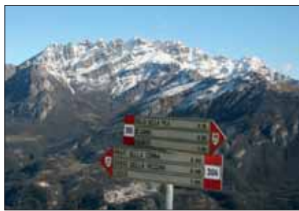
Dalla vetta - Segnaletica e Monte Resegone