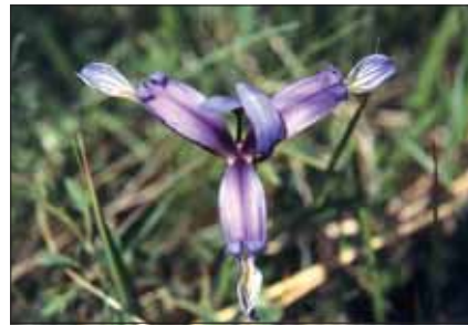
Giaggiolo susinario ( Iris graminea )