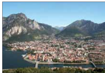
Dal Barro - La Città di Lecco