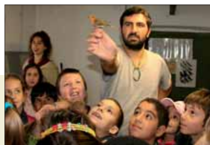
Un pettirosso appena inanellato

Per visite guidate Aster s.r.l. - Tel./Fax (39) 02 20421469 segreteria@spazioaster.it Parco Monte Barro Tel. (39) 0341 542266 Fax (39) 0341 240216 info@parcobarro.it