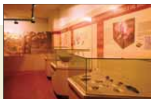
Una delle sale del Museo Archeologico