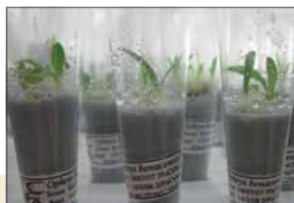
Propagazione in vitro di orchidee rare

Per visite guidate Aster s.r.l. Tel./Fax (39) 02 20421469 segreteria@spazioaster.it