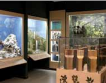
Centro Parco - Gli ambienti del monte

Dove si trova il Centro Parco e il Parco archeologico dei Piani di Barra. Riferimenti 4 e 3 in piantina. www.parcobarro.it