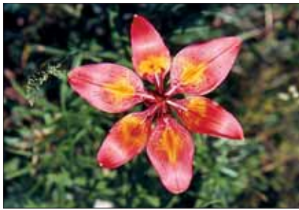
Giglio rosso ( Lilium bulbiferum )