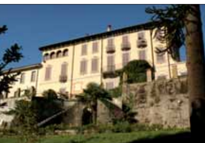
La facciata di Villa Bertarelli

L'insediamento presso la villa del Centro Flora Autoctona ha comportato la sistemazione dei camminamenti sotterranei, delle grotte e dell'antica serra con l'organizzazione di percorsi opportunamente attrezzati aventi a tema la biodiversità vegetale.