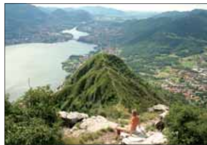
Dalla vetta - Il Lago di Garlate e la Valle dell'Adda