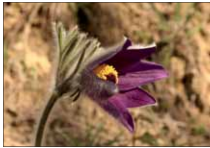
Pulsatilla comune ( Pulsatilla montana - fiore assunto a simbolo del Parco)