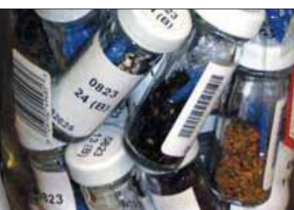
Semi pronti per il congelamento nella Banca del Germoplasma

Il CFA è coinvolto in molti progetti quali la riqualificazione floristica di boschi degradati di pianura, la produzione di sementi per inerbimenti di aree denudate (cave, piste da sci, ecc.), la produzione di piante rare o minacciate per interventi di ripopolamento e/o reintroduzione. Il CFA è stato costituito dal Parco e riconosciuto nel 2000 dalla Regione Lombardia, e ad esso aderiscono, oltre alla Regione stessa, la Fondazione Minoprio (sperimentazione agronomica) e la Università degli Studi dell'Insubria (supervisione scientifica) e di Pavia (Banca del Germoplasma).