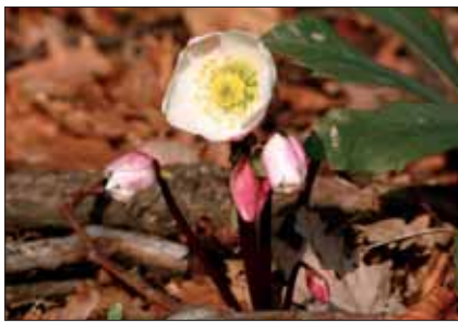
Rosa di Natale ( Helleborus niger )