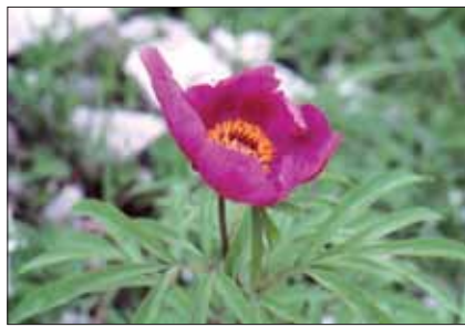
Peonia selvatica ( Paeonia officinalis )