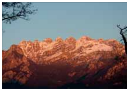
Dal Barro - Tramonto sul Resegone