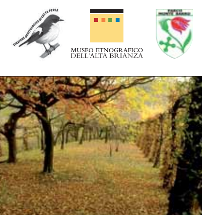
Interno del Roccolo di Costa Perla

La Stazione esegue anche studi sull'avifauna nidificante sul Monte Barro e partecipa a programmi di ricerca nazionali ed internazionali.