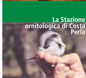
La Stazione ornitologica di Costa Perla

Il Museo, inserito nel borgo agricolo di Camporeso, documenta la vita quotidiana delle classi popolari in Brianza e nel Lecchese nei secoli XIX e XX, proponendo al visitatore, un'occasione di confronto tra culture diverse. Presenta un'ambientazione articolata in vari spazi: il locale per l'allevamento del baco da seta, la cucina, la stalla, la cantina, il portico dedicato ai trasporti, la sala sul lavoro dei campi e quella riservata al flauto di Pan. Il Museo organizza incontri con i testimoni della tradizione, mostre temporanee, conferenze, convegni, corsi di formazione e attività con le scuole.