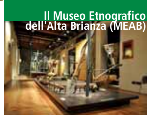
Il Museo Etnografico dell'Alta Brianza (MEAB)

Il Parco archeologico, visitabile liberamente tutto l'anno, è sottostante l'Eremo e da qui raggiungibile in pochi minuti. Si articola in terrazze pianeggianti e si estende per circa 8 ettari in un contesto ambientale di notevole impatto paesaggistico. Il visitatore è guidato da pannelli didascalici che illustrano i resti dell'abitato di epoca gota (V - VI sec. d.C.) costituito da una dozzina di edifici portati alla luce. Al Museo archeologico del Barro, presso l'Eremo, sono esposti i reperti (più di 400) qui rinvenuti durante le campagne di scavo effettuate dal Parco tra il 1986 e il 1997.