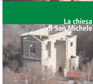
La chiesa di San Michele

La stazione ha sede in un vecchio roccolo acquistato e riconvertito dal Parco in centro di studio sulle migrazioni degli uccelli. È stato riconosciuto Stazione Sperimentale della Regione Lombardia con finalità scientifiche e didattiche. Gli uccelli catturati vengono inanellati, misurati e rimessi in libertà senza essere danneggiati. Ad oggi sono stati contrassegnati più di 30.000 uccelli appartenenti ad 88 specie diverse; alcuni sono stati poi ritrovati in diverse località europee ed africane. È anche sede della sezione staccata del MEAB dedicata all'uccellazione e alla caccia tradizionale.