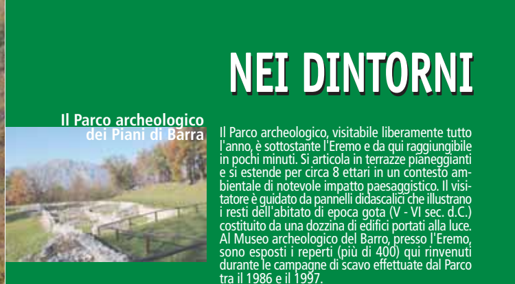
Il Parco archeologico dei Piani di Barra