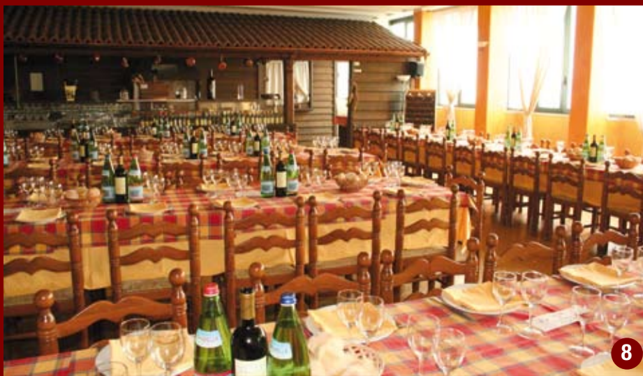
1. Il Barro visto dal Monte San Martino - 2. Panorama dall'Eremo - 3. Attività didattiche nel Parco - 4, 5, 6, 7. L'Eremo con l'Ostello Parco Monte Barro - 8. Il Ristorante dell'Eremo